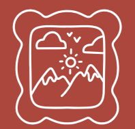
ILLUSTRATION : ATELIER NATURE   TERRITOIRES - 2022. GRAPHISME PAR LE POLYGRAPHE. IMPRIM  PAR TOOT. COPIES.

Des envies artistiques? En fl nant dans le village, n'h sitez pas   passer la porte des diff rentes galeries que vous pourrez trouver!