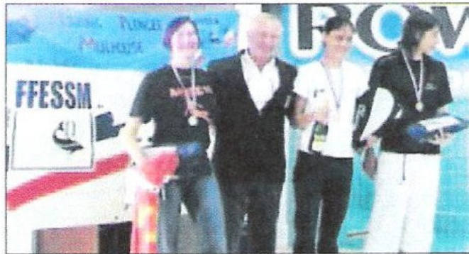
Les deux apnéistes audoises sur le podium de Mulhouse.

L'apnée statique : l'apnéiste s'immerge à faible profondeur, ou im-