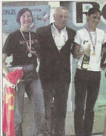
Les deux représentantes Audoises sur le podium.