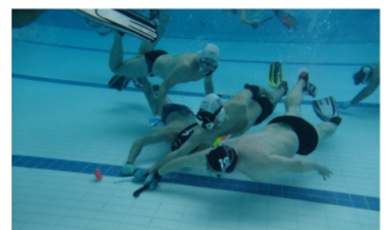
CHAMPIONNAT de FRANCE 4 ème DIVISION 7 et 8 mai 2011 à Limoux