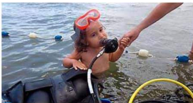
Une initiation à la plongée dès le plus jeune âge.