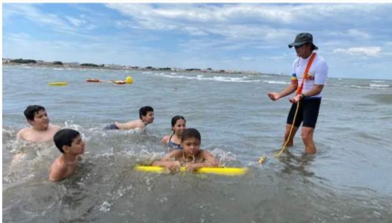
Des gestes simples au Grau-du-Roi pour éviter la noyade.

La mer et ses dangers, le club subaquatique des pompiers du Gard a organisé ce mercredi des ateliers ouverts aux enfants des centres aérés ou vacanciers au Grau-du-Roi. Objectif : leur permettre de mesurer leur aisance dans l'eau et les gestes de base du secourisme.