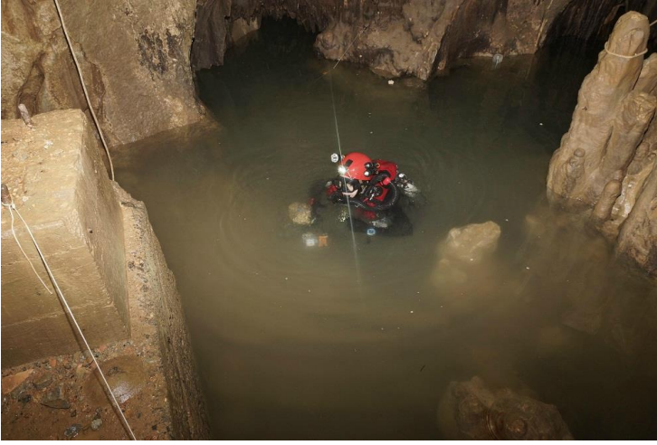
Socle en béton au pied du lac d'entrée.

direction du Trou des Morts (autre fois second accès