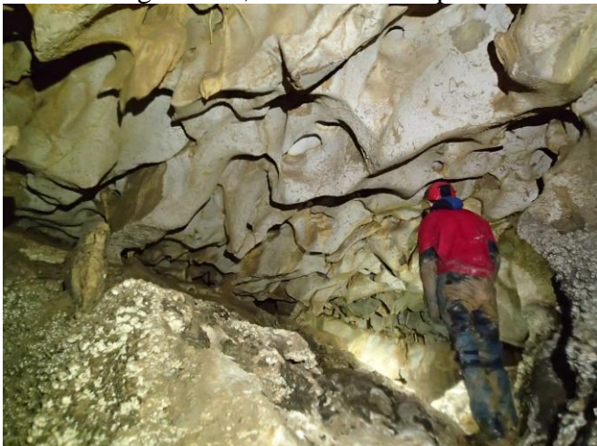
Plafond corrodé de la zone terminale semi-noyée.

au réseau mais aujourd'hui bétonné en surface) et le second à l'Est qui donne sur un réseau noyé à plusieurs étages à -20, -50 et -70m de profondeur.