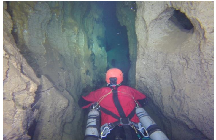
Diaclase du trou des morts. tirée d'une vidéo –