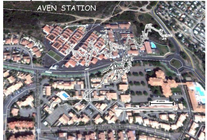
Report de surface