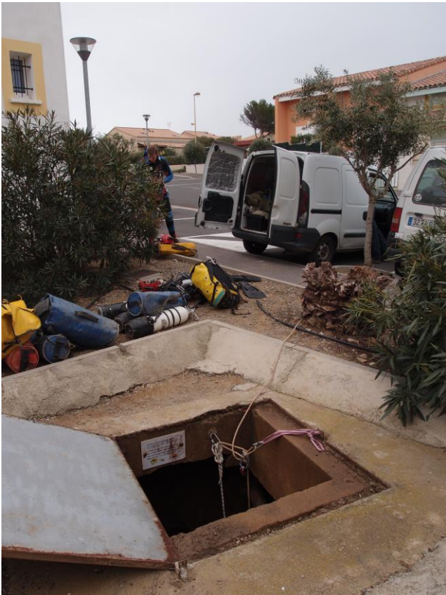
Entrée de l'Aven de la Station.

En 1981, 1982 et 1983, Vargas, Fraisse, Mazot et Monnier du MJC Narbonne explorent et réalisent les premières plongées, établissent la jonction avec l'aven des Morts par un siphon de 80m (-13) et dressent une topographie dont le développement reste approximatif (de 1 000 à 1 500m...).