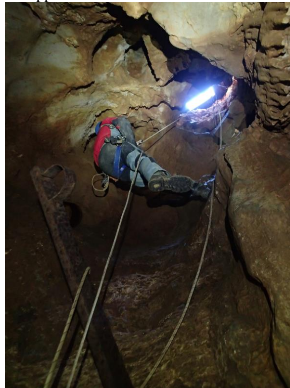
Puits d'entrée.

Sous la trappe, l'unique puits de la cavité mesure 15 m, à sa base on prend pied sur un socle en béton au pied d'un lac, une galerie basse au Nord donne accès au réseau Est formé d'un enchaînement de salles aux dimensions moyennes avec de nombreux regards sur la nappe.