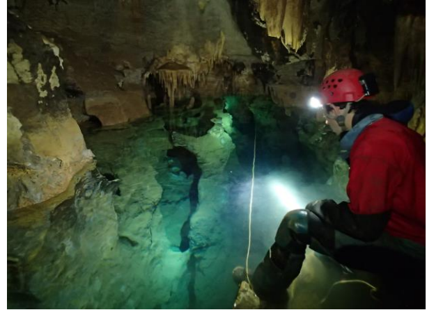
Lac du pont de singe.

Sur l'autre Branche plus proche de l'entrée et partant vers le Nord ce sont 90m qui ont été ajoutés sur trois galeries différentes la principale butant sur une trémie à -3m. A ce point-là nous sommes très proches de la surface.