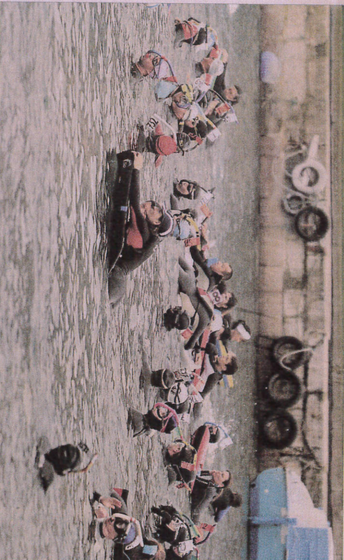
■ C'était, hier, la 45 e édition d'une épreuve qui rencontre de plus en plus de succès. Pas moins de 39 clubs étaient représentés ! Sète | P. 4