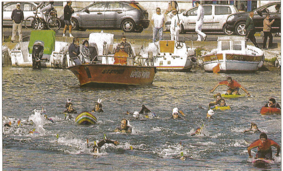
■ L'an passé, 146 participants s'étaient affrontés, représentant 32 clubs.

Sur ces parcours, sera également proposée une catégorie pour nageurs avec support (flotteurs). Et tous ne nageront pas que pour le plaisir. Le 6000 m de cette catégorie sera ainsi sélectif pour